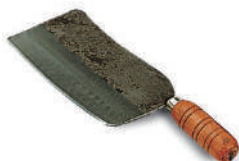
台北西門魯肉刀 knife 07755 / 29.5cm