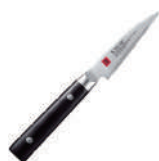
霞 去皮刀 knife 60535 / 8cm