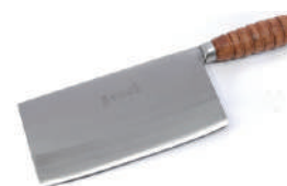
青龍別作骨刀 knife 08209 / 6.5寸