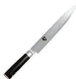
旬 切片刀 knife 07313 / 22.5cm