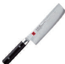
霞 薄刃鋼刀 knife 60530 / 17cm