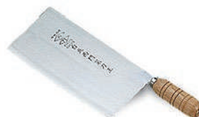
台北西門片刀 knife 07747 / 6寸5 07748 / 7寸 07749 / 7寸8