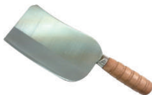
青龍別作魯肉刀 knife 08210 / 6 寸