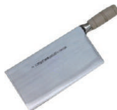
陳枝記文武刀 knife 07888 #1 長 24 寬 12.5 07889 #2 長 22.5 寬 12 49683 #3 長 21.5 寬 11