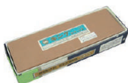
KING 油石 (新)#800-2 10554