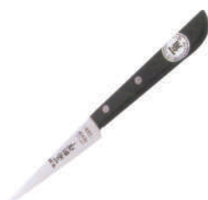
一角刻花刀 knife 07299 / 9cm 07249 / 10.5cm 07254 / 12cm