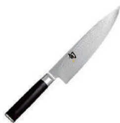
旬 牛刀 knife 07318 / 20.3cm