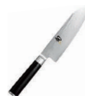
旬 三德鋼刀 knife 07312 / 16cm 07317 / 16.5cm