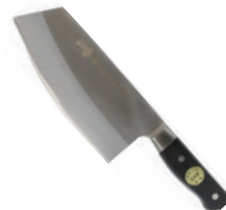
尖金郎三合鋼片刀 knife 07914 / 29.5cm