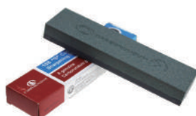
雙面油石 150/400 77214