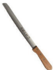
日本麵包刀 knife 08198 / 23.5cm