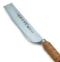
西門鴨刀 knife 11891 / 28cm