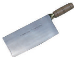
陳枝記木柄不鏽鋼小片刀 knife 38003 / 長 21 寬 9.5 38004 / 長 20.5 寬 9