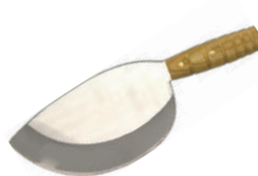
豬刀 knife 08923