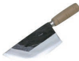
陳枝記毛刀 knife 28984 / 長 15 寬 7