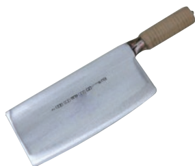
陳枝記骨刀 knife 07865 / #1 L23 寬 10.5 07866 / #2 L22.5 寬 10 51190 / #3 L22 寬 9.5