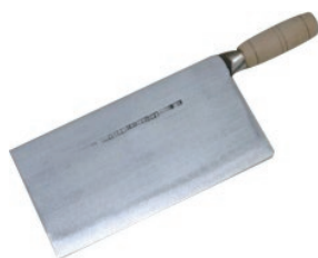
陳枝記片刀 knife 38005 / #1 長 24 寬 12.5 38006 / #2 長 23 寬 12 38007 / #3 長 22.5 寬 11.5