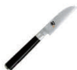
旬 水果刀 knife 49666 / 9cm