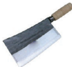
陳枝記九江刀 knife 07873 / #1 長 19 寬 12 25409 / #2 長 18 寬 11 07875 / #3 長 20 寬 13