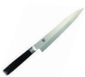
旬 生魚片刀 knife 07319 / 22.8cm 07369 / 24cm 07370 / 27cm