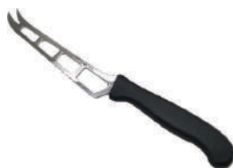
乳酪刀 knife 06684 / 25.5cm