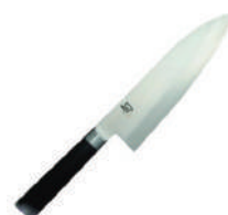
旬 雞肉刀 knife 07366 / 16.5cm 07367 / 21cm