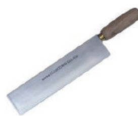
陳枝記港式鴨刀 knife 07883 長 18 寬 5