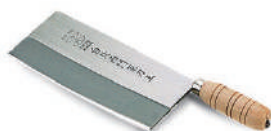
西門骨刀 knife 07756 / 7寸