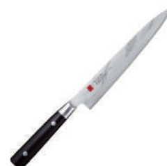
霞 切片刀 knife 34381 / 27cm