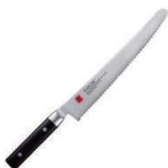
鋸齒麵包刀 knife 60528 / 25cm