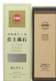
KING 特級油石 附座 35423 / #1000 35424 / #1500 35461 / #4000 35459 / #6000