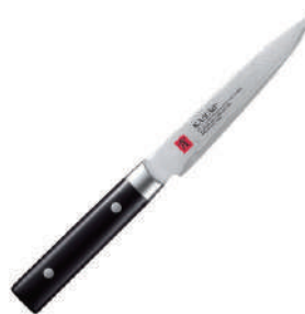
霞 廚房多用途刀 knife 60533 / 12cm 60531 / 16cm