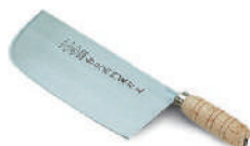
台北西門上海片刀 knife 07752 / 7寸 07753 / 7寸8