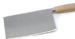
青龍別作文武刀 knife 08207 / 6.5寸