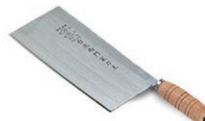
台北西門文武刀 knife 07750 / 7寸 07751 / 7寸8