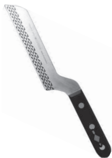
乳酪刀 knife 08074 / 12cm