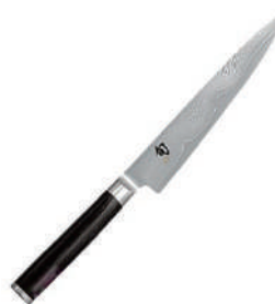
旬 萬能廚房用刀 knife 07311 / 15cm 42988 / 19cm