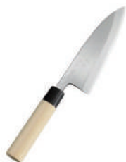
正廣雞肉刀 knife 07335 / 16.5cm 07336 / 18cm 07338 / 19.5cm 07339 / 21cm

昆庭國際興業有限公司 104台北市中山北路三段55巷30號1樓 Tel / 02-25869889 Fax / 02-25869886 www.ddbrothers.com