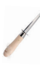
生蠔刀 knife 07344 / 21cm