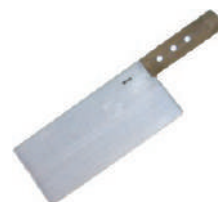
陳枝記港式拍皮刀 knife 07884 / 長 20.5 寬 9