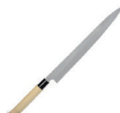
正廣生魚片刀 knife 07328 / 21cm 07329 / 24cm 07330 / 27cm 07333 / 30cm