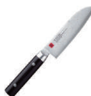
霞 三德小刨丁 knife 60532 / 14cm