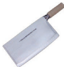
陳枝記燒臘刀 knife 38000 / #1 長 25 寬 13.5 38001 / #2 長 24.5 寬 13 38002 / #3 長 24 寬 12.5