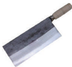
陳枝記桑刀 knife 07867 / 長 24 寬 10 07868 / 長 21 寬 9.5 07869 / 長 20 寬 9