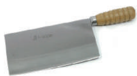
青龍不鏽鋼片刀 knife 08214 / 6 寸 08216 / 6.5 寸 08217 / 7.2 寸