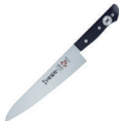
一角牛刀 knife 07256 / 24cm 07265 / 27cm 07735 / 27cm 07257 / 30cm