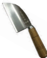
青龍檳榔刀 knife 08277 / 19cm