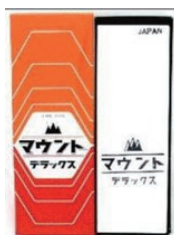
單面油石 虎 2000 / #500