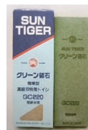
KING 朝日虎 油石 大 #220 35413