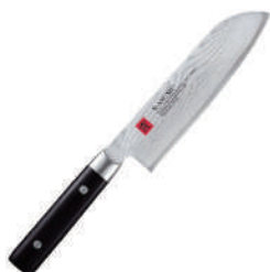
霞 (寬) 三德鋼刀 knife 60529 / 18cm