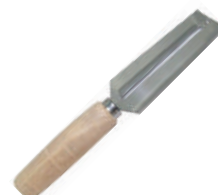
陳枝記木柄不鏽鋼刮刨刀 knife 25551 / 長 17