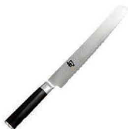
旬 麵包刀 knife 07314 / 22.5cm