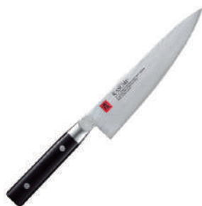
霞 主廚用牛刀 knife 49664 / 20cm 33823 / 24cm