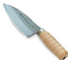
台北西門魚刀 knife 07757 / 22.5cm