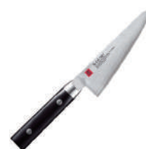
霞 角型骨刀 knife 60534 / 14cm