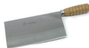
青龍別作片刀 knife 08203 / 6 寸 08204 / 6.5 寸 08205 / 7.2 寸