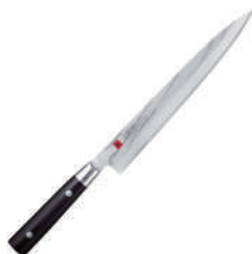
霞 積層鋼生魚片刀 knife 49663 / 21cm 60527 / 24cm 22051 / 27cm